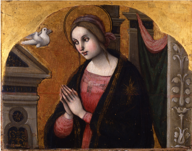
Stefano Sparano, Vierge de l'Annonciation Elément d'un retable du XVI e siècle

Exposition présentée au Musée de Picardie à Amiens du 10 mars au 02 juillet 2017